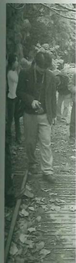
92年3月份徐裕牌倉庫會勘(攝影有限公司) 歷史公園」新可預期的能量，將足方化地圖。不諳人文史蹟豐富