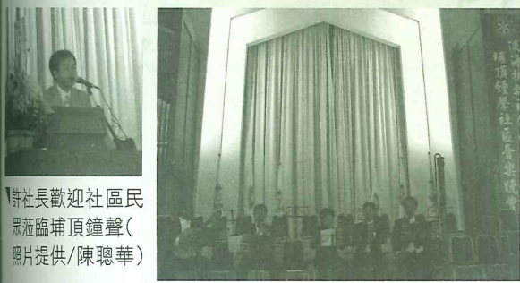
許社長歡迎社區民 眾蒞臨埔頂鐘聲