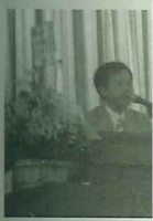
▲許社長歡迎民眾蒞臨埔頂鎮